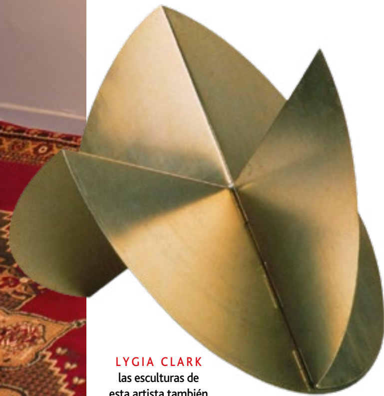
LYGIA CLARK las esculturas de esta artista también están entre sus recomendadas

“ Siempre hay que ver más allá de la obra. No es solo comprar lo que te gusta sino entender por qué lo estás comprando ”