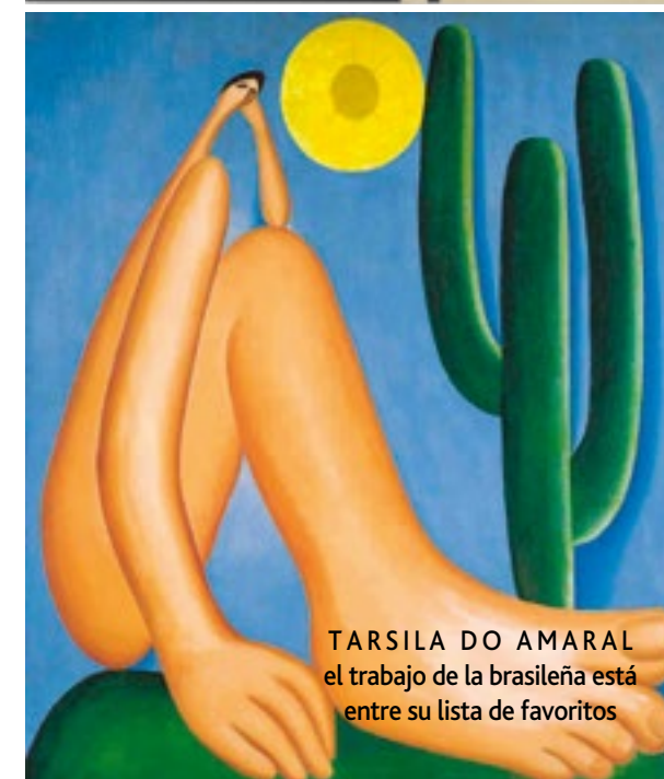
TARSILA DO AMARAL el trabajo de la brasileña está entre su lista de favoritos