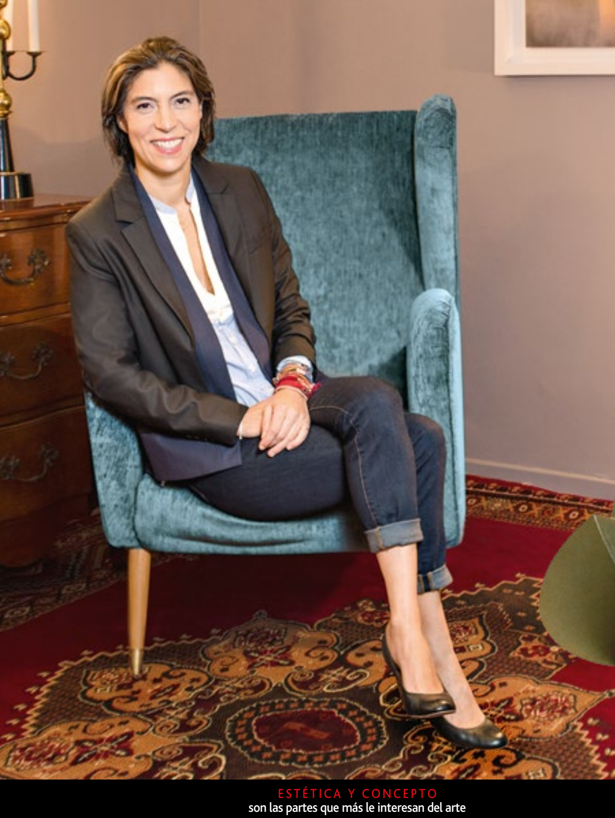
ESTÉTICA Y CONCEPTO son las partes que más le interesan del arte

“ Siempre hay que ver más allá de la obra. No es solo comprar lo que te gusta sino entender por qué lo estás comprando ”