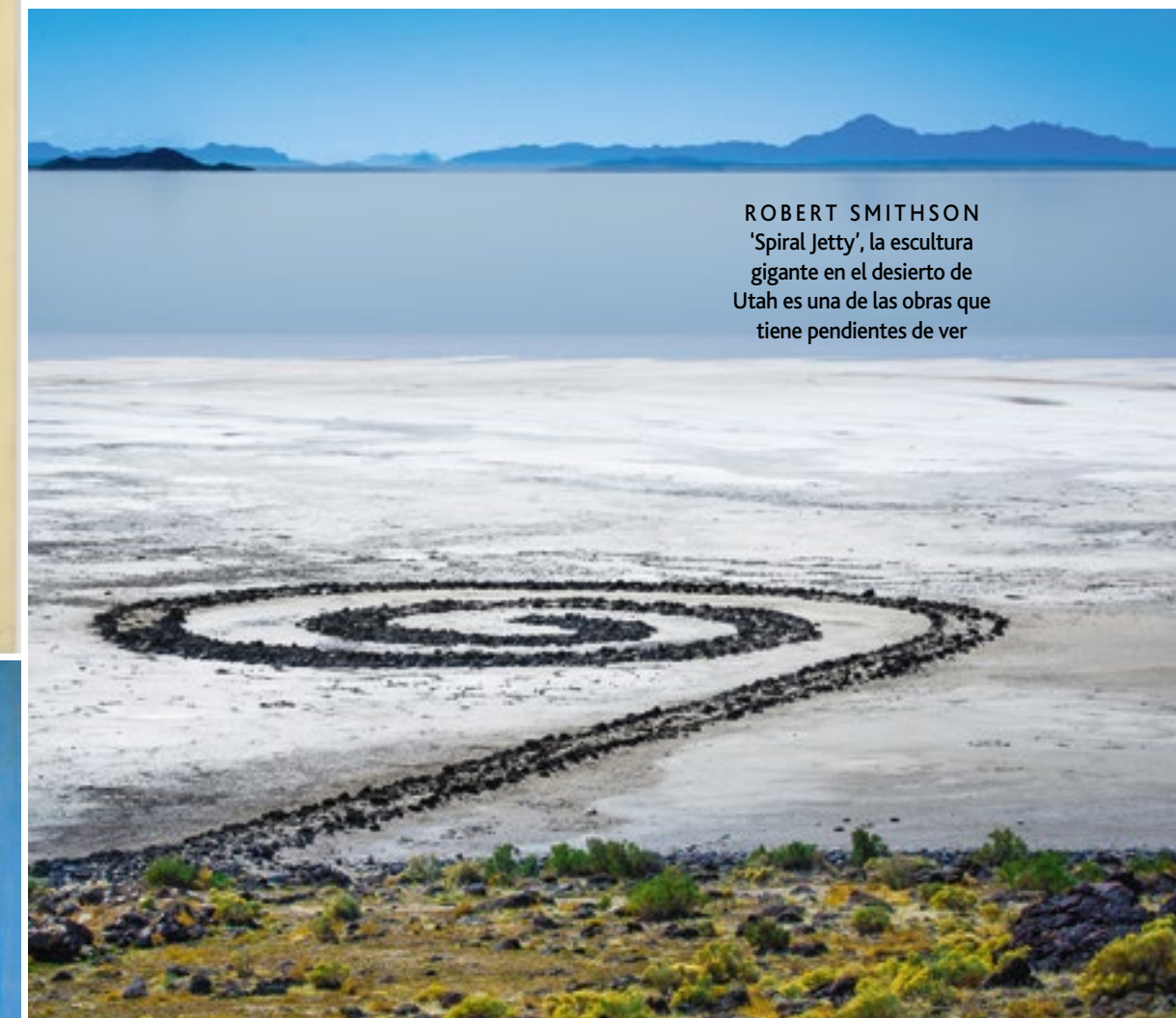
ROBERT SMITHSON 'Spiral Jetty', la escultura gigante en el desierto de Utah es una de las obras que tiene pendientes de ver

A.S.: Que se atrevan a coleccionar. Creo que hacerlo es entrar a un mundo donde se aprende todo tipo de cosas. No solo es comprar lo que te gusta sino entender por qué